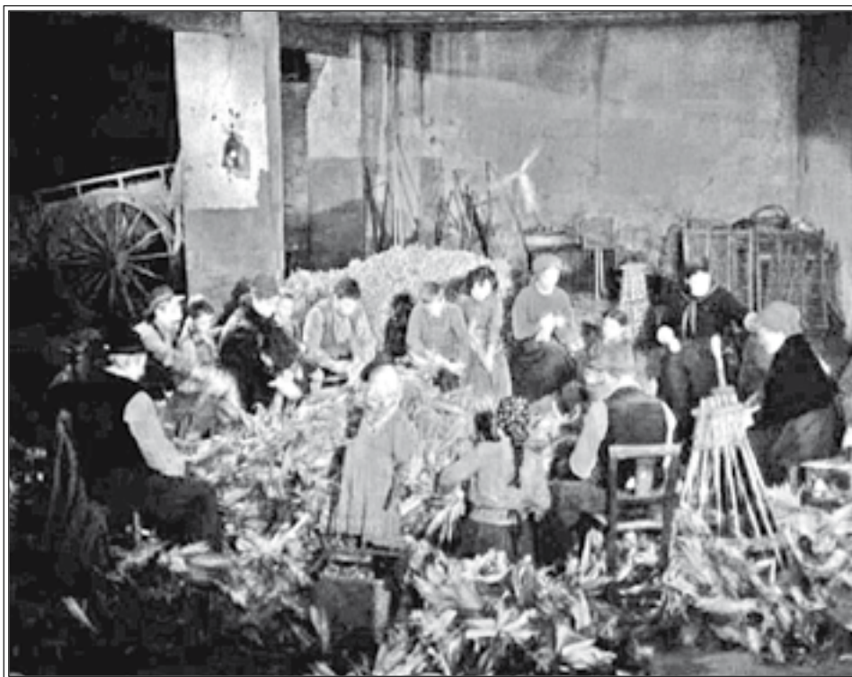
Da L'albero degli zoccoli , Palma d'oro a Cannes, 1978.

Gli chiesi, molto interessato, de “ Il sergente nella neve ”, rapidamente e con profonda