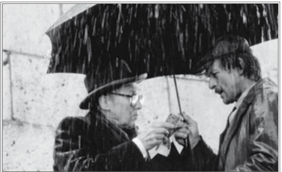
Da Il segreto del santo bevitore , Leone d'oro al Festival di Venezia del 1989.