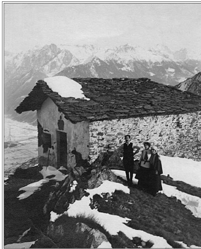
1912: La cappellina di San Sfirio al Legnoncino.