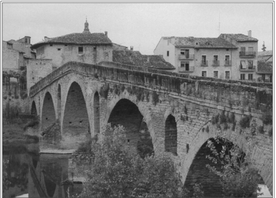
Il ponte romanico (XI sec.) de La reina .