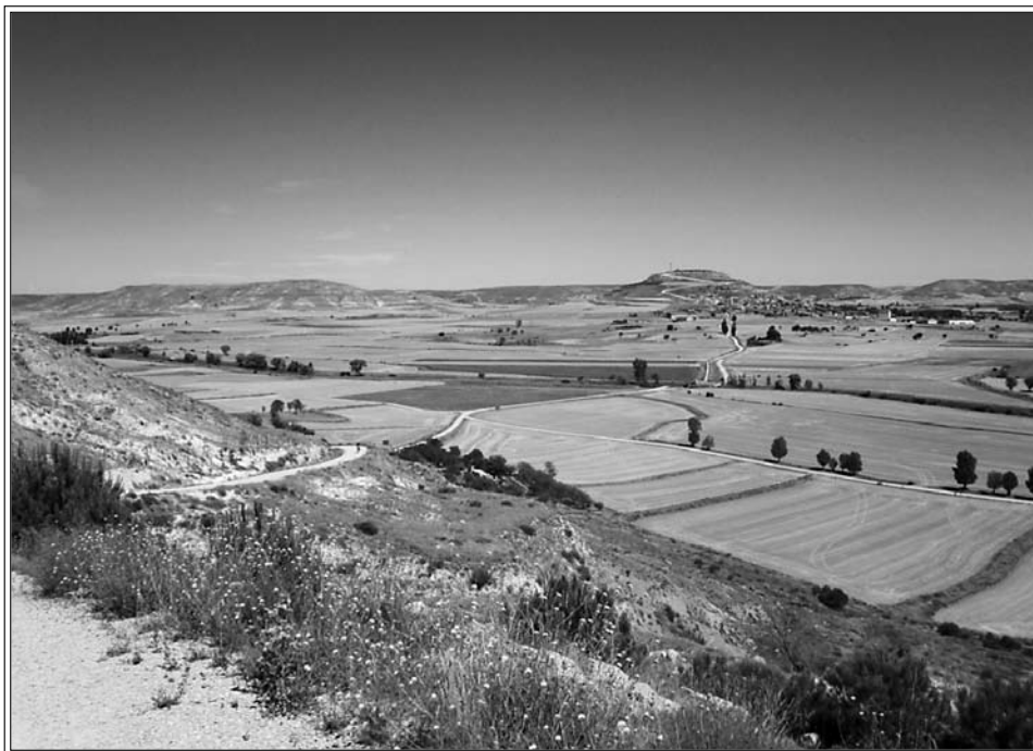
Lo spazio sconfinato e assoluto della Meseta.

Non sono da trascurare alcuni luoghi lungo il Cammino. Ad esempio, la salita subito dopo Saint Jean Pied de Port che, per l'influenza dell'oceano vicino non ha quasi mai un clima ben definito, ma che può facilmente diventare pioggia lieve, con nebbia e cielo coperto che ci fa scordare di essere magari in estate. Indescrivibile a parole.