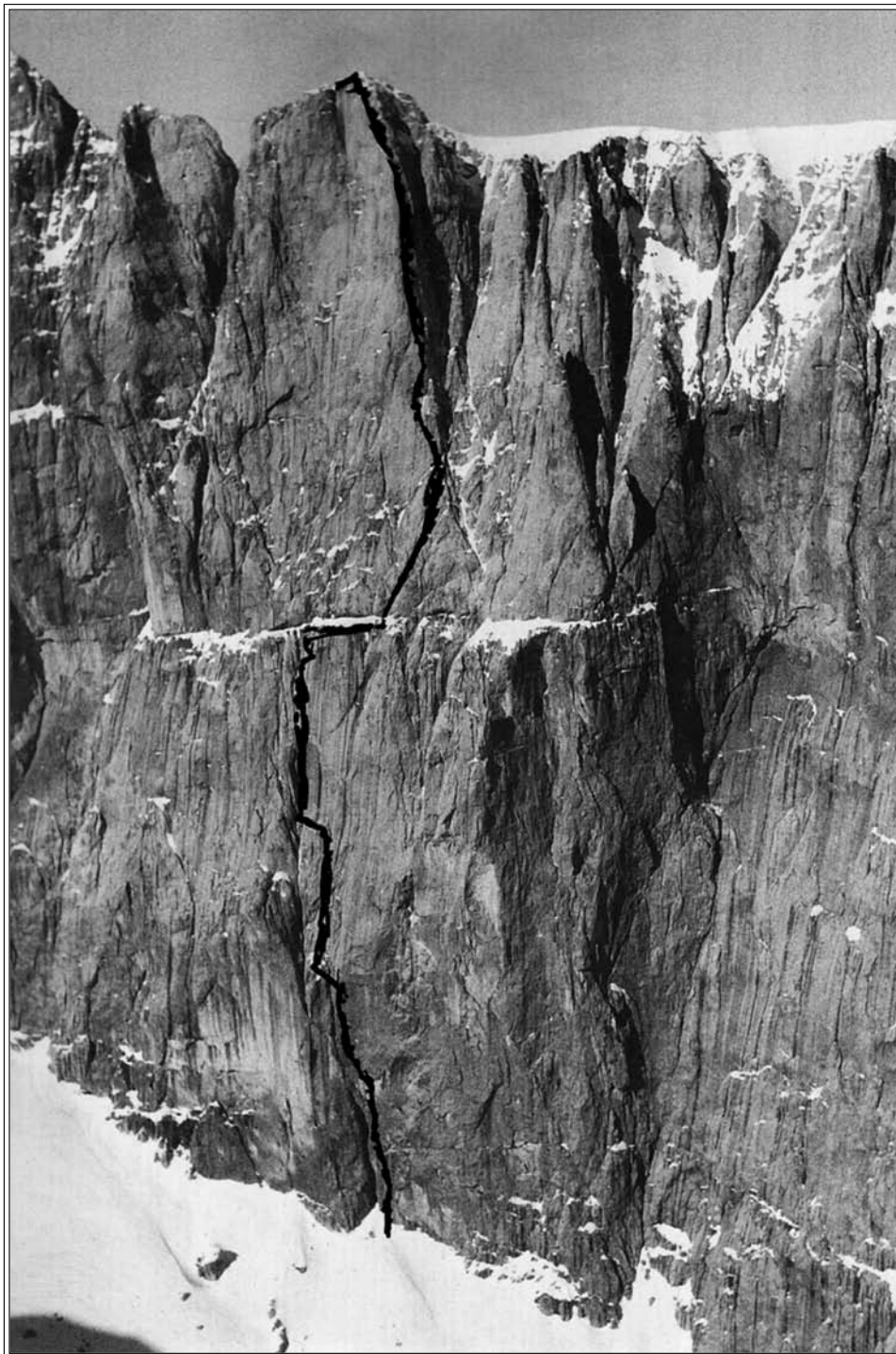
Particolare della Sud della Marmolada con in evidenza la Vinatzer-Castiglioni.