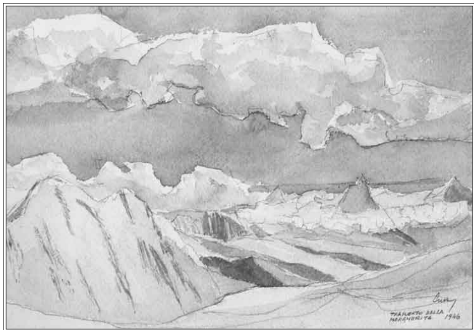
Tramonto dalla Margherita, 1946.

Poi arrivarono a 16 anni alcuni 3.000 in val Formazza, a 18 il Leone (mt 3.552)