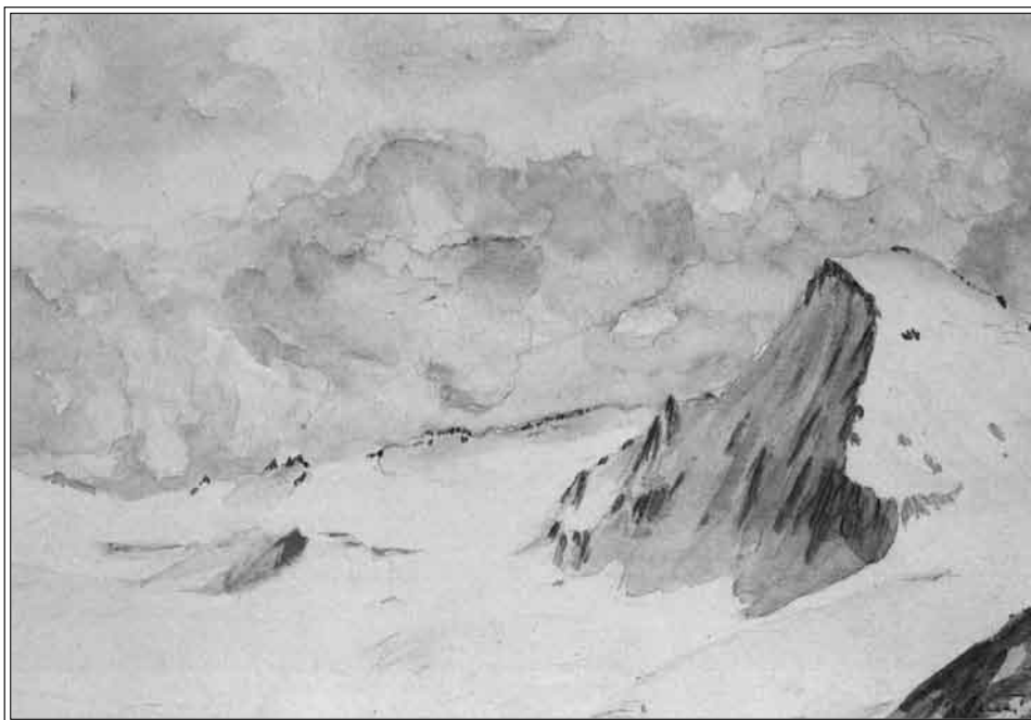
Hosandhorn, giugno 1946.

La partecipazione attiva alla vita pubblica e associativa mi ha dato la possibilità di mettere al servizio della collettività le mie esperienze ma, soprattutto, di prendere coscienza dell'impegno che tali prestazioni, se sviluppate con la dovuta serietà e rigorosità, richiedono pesanti sacrifici di tempo. Purtroppo ho dovuto constatare già negli anni '70 / '90 che nel mondo politico esiste il rigetto per chi proviene dal mondo reale dell'economia.