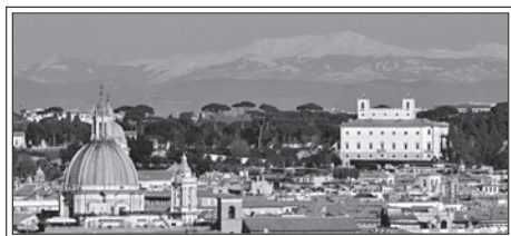
Il Terminillo dal centro di Roma

Gli aspetti organizzativi già sono stati diramati alle sezioni. Qui, come rivista, spetta ricordare l'appuntamento, che darà occasione di conoscere una località che chi viene da "fuori mura" difficilmente potrebbe incrociare. L'occasione propizia è appunto offerta dall'incontro intersezionale di settembre. Intesi soci?