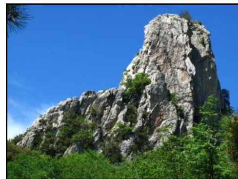
La quarzítica Rocca dell'Aia emerge dai boschi nell'entroterra di Loano

N.B.: L'uscita, inizialmente prevista in calendario per il giorno 5/5, è stata posticipata per ragioni organizzative.