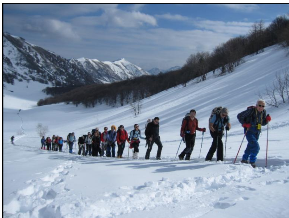
Ciaspolando nel Vallone Desertetto, verso la Cima Cialancia - 17/2/2013