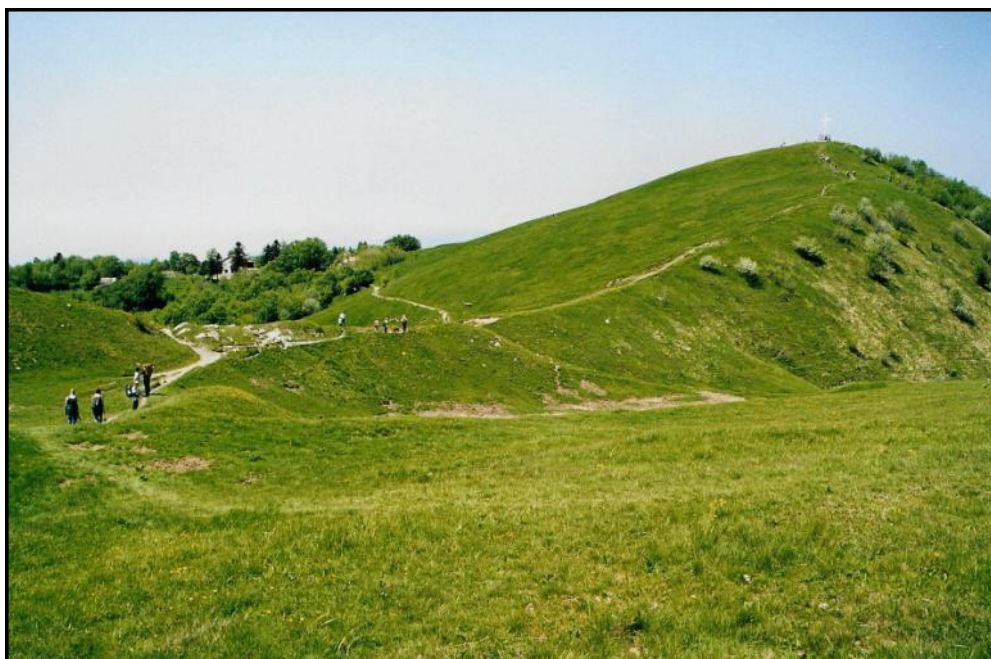
La vetta del M. Antola (1597 m)