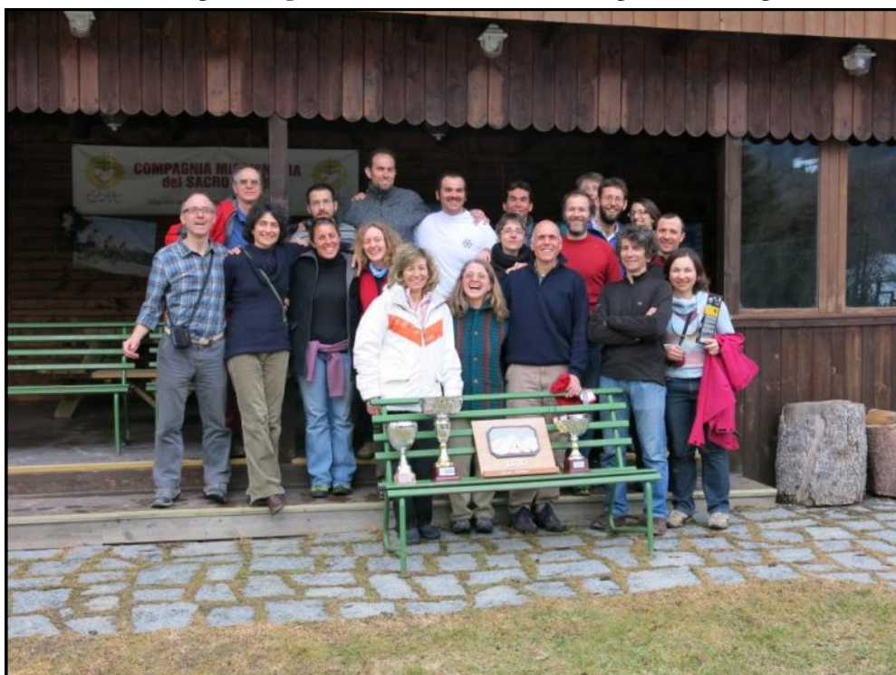
Lo “squadrone” genovese al Rally sci alpinistico in Val Pusteria - 10/3/2013