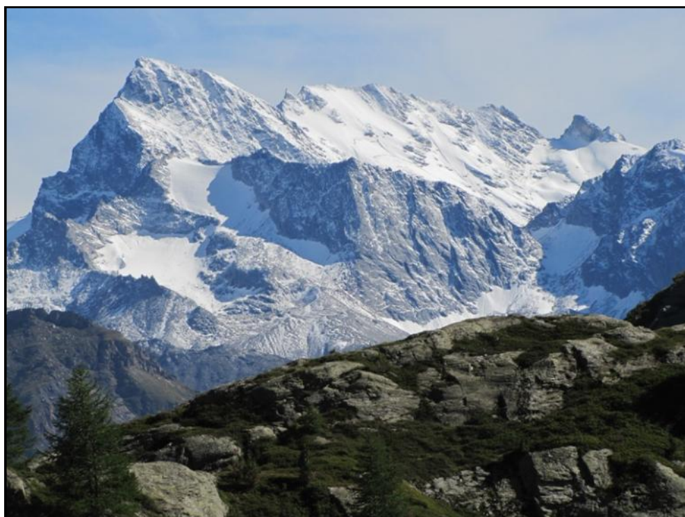
L'imponente massiccio della Grande Rousse (3607 m)