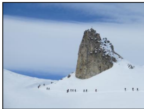
Traverso sotto la Pera Puntua - gita al M.Gorfi - 27/1/2013

Frattanto il sole è tornato a splendere e domenica 27 i ciaspolatori recuperano la gita annullata la settimana prima dirigendosi in forze sul Monte Antola che è "baciato" da neve farinosa e dal cielo azzurro, mentre gli scialpinisti, numerosissimi, vanno, come da programma, al Monte Gorfi in Valle Stura: molti di loro sono alle prime armi e faticano un po', ma alla fine tutti in vetta ed in tempi più che accettabili.