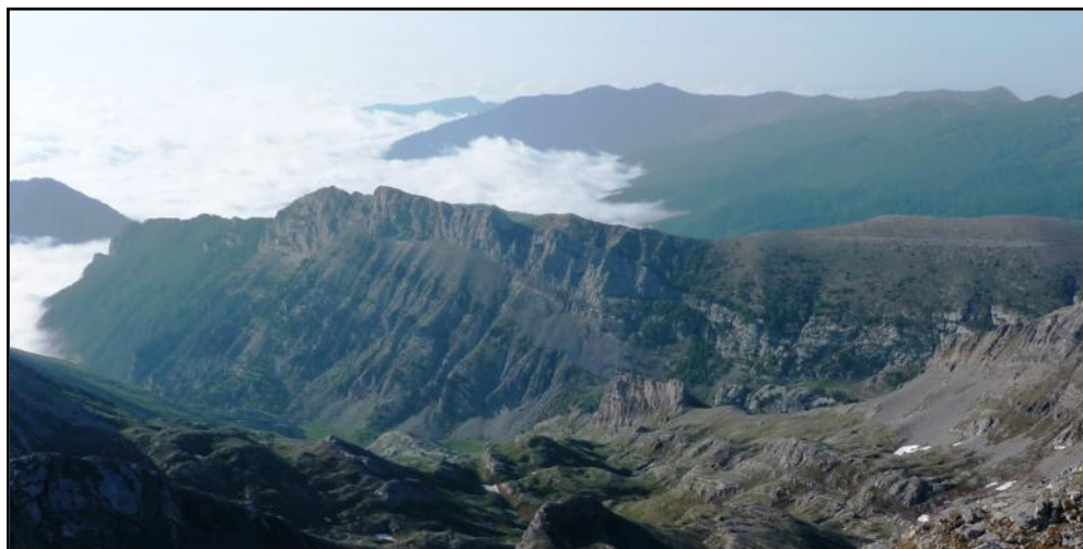
L'aspra e selvaggia Cresta del Ferà (Alpi Liguri)

La torrentistica di quest'anno vorrebbe vedere la partecipazione di un folto gruppo di bambini, per cui la scelta sarà fatta in base al numero e all'età dei partecipanti. Due sono i canyon che potrebbero avere le caratteristiche adatte allo scopo: il Vallon de Audin ed il Rio delle Pili. Il primo si trova in val Roya e presenta un percorso breve e soleggiato con calata più alta di 5 m e qualche simpatico scivolo. Occorrono circa 50 minuti di avvicinamento, un'ora e 45 minuti di discesa e 20 minuti di rientro. Il secondo si trova presso Fabbriche di Vallico in Toscana ed è una divertente forra piuttosto stretta anche se non profondamente incassata, in un ambiente verdeggianti fra basse cascate, con frequenti tuffi e toboga. La calata più alta è di 12 m e i tempi medi di percorrenza