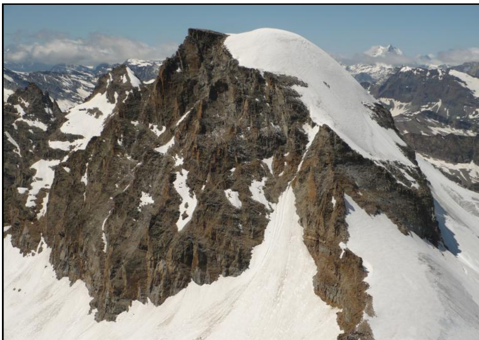
La calotta sommitale del Ciarforon (3640 m)

sono 5 minuti di avvicinamento, 2 ore e mezza di discesa e 5 minuti di rientro.